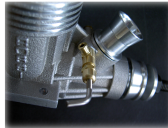
Bild 3 Venturi

Wir empfehlen eine Durchlassöffnung des Trichters von 10,5 mm.